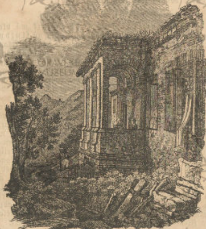
Petrarkův dům ve vsi Arquà.

Z úcty k tomuto velikému básníku naznamenali saurveci mužové veliká místa přebývánj jeho a zůstavili je potomstvu. Darovaný genu dům od Benátčanů na slowanském nábreží (Riva degli Schiavoni) ukazuje se posud cizincům za nejvěstší znamenitost toho města. Dobyvatelé Arezzo sťj naznačili místo jeho narození dlouhým nápisem. V Pavii, kde podzim roku 1368 ztrávil, zřídila se mu poprsnj podobizna a pamětnj tabule. Dům v Padově gest od Tomassiniho popsan, a přemnozi naučtewugi posud Bosluzi, ačkoli tamější obydlj jeho zmizelo, ba nelze ani určitj položeni zahrady, ve které Petrarka tolik věčnjch myšlenek byl napsal.